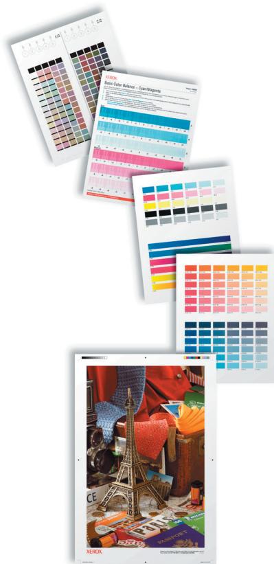
Díky vestavěným nástrojům pro kalibraci barev bude finální výstup odpovídat vašim představám.