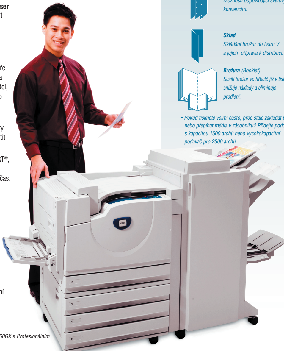
Phaser 7760GX s Profesionálním finišerem