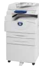
WorkCentre 5020DN s automatickou duplexní jednotkou, volitelným druhým zásobníkem a podstavcem

podle norem 2006 / 95 / EC, 2004 / 108 / EC, 1999 / 5 / EC