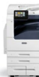
Multifunkční tiskárna Xerox® VersaLink® B7025/B7030/B7035