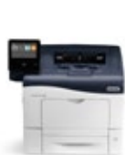
Barevná tiskárna Xerox® VersaLink® C400