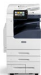
Barevná multifunkční tiskárna Xerox® VersaLink® C7020/ C7025/C7030