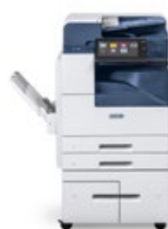
Multifunkční tiskárna Xerox® AltaLink® B8045/ 8055/8065/8075/8090

Další informace o technologii ConnectKey naleznete na adrese www.xerox.com