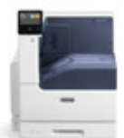
Barevná tiskárna Xerox® VersaLink® C7000