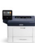
Tiskárna Xerox® VersaLink® B400