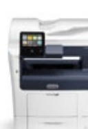
Multifunkční tiskárna Xerox® VersaLink® B405