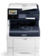
Barevná multifunkční tiskárna Xerox® VersaLink® C405