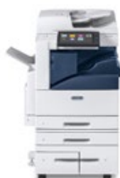
Barevná multifunkční tiskárna Xerox® AltaLink® C8030/C8035/C8045/ C8055/C8070