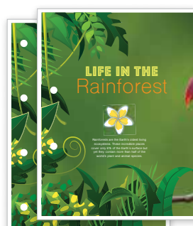
Děrování – 2 nebo 4 otvory