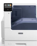
Barevná tiskárna Xerox® VersaLink® C7000