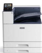
Barevná tiskárna Xerox® VersaLink® C8000