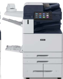
Barevná multifunkční tiskárna Xerox® AltaLink® C8130/C8135/C8145/C8155/C8170