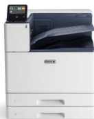
Barevná tiskárna Xerox® VersaLink® C9000