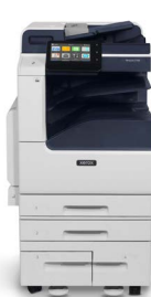
Barevná multifunkční tiskárna Xerox® VersaLink® C7120/C7125/C7130