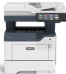
Multifunkční tiskárna Xerox® VersaLink® B415