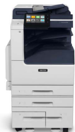
Xerox® VersaLink® B7125/B7130/B7135 Multifunkční tiskárna