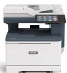
Barevná multifunkční tiskárna Xerox® VersaLink® C415