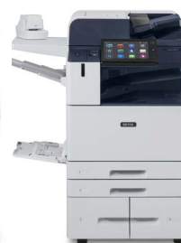
Multifunkční tiskárna Xerox® AltaLink® B8145/B8155/B8170

* Výrobek není dostupný ve všech zemích. Obráťte se prosím na svého obchodního zástupce.