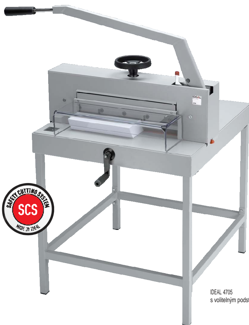
IDEAL 4705 s volitelným podstavcem