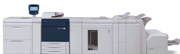
Barevná produkční tiskárna Xerox® 770

S tím, jak se rozšiřují potřeby vašich zákazníků, může se rozrůstat i vaše barevná produkční tiskárna Xerox® 770, o konfigurace přidávající flexibilitu aplikací a vyšší produktivitu, které vám pomohou dosáhnout vašich cílů.