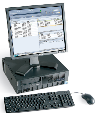
Kontroler Xerox® FreeFlow® verze 8

Při výběru nejvhodnějšího kontroleru vám pomůže autorizovaný zástupce společnosti Xerox.