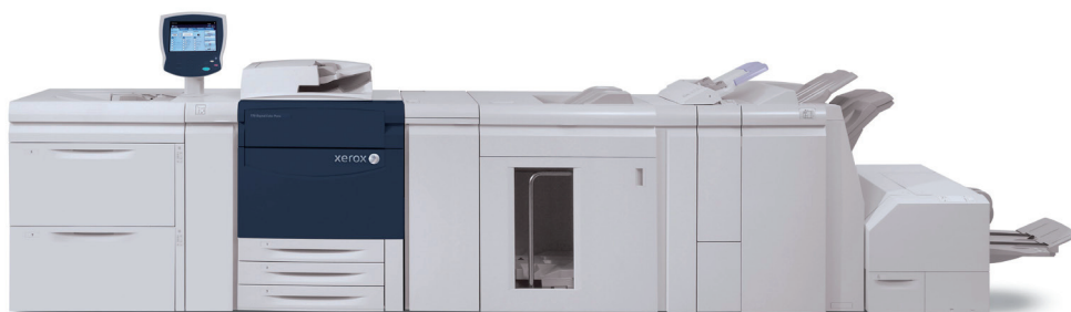
Barevná produkční tiskárna Xerox® 770