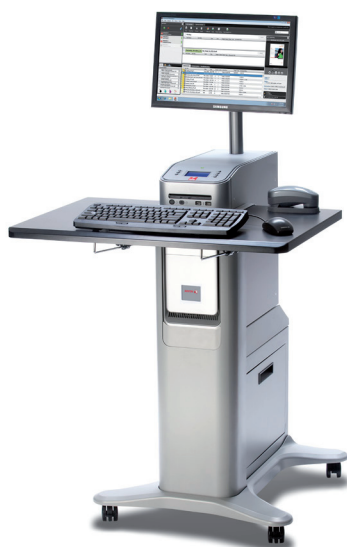
Kontroler Xerox® EX, Powered by Fiery®