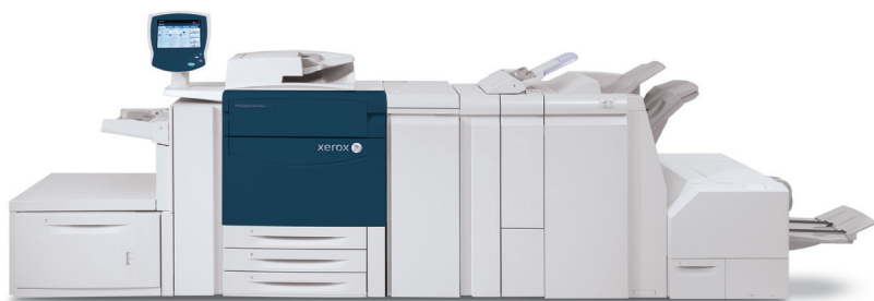
Barevná produkční tiskárna Xerox® 770

Barevná produkční tiskárna Xerox® 770 je vskutku nejnovější, nejflexibilnější, kompaktní tiskárna produkční třídy, které vám umožní snadno začít s digitálním produkčním tiskem. Díky rychlosti, podpoře médií a možnostem inuline dokončovacího zpracování budete mít díky tiskárně Xerox® 770 na dosah širokou škálu aplikací s vysokou hodnotou. A co je na tom nejlepší – nabízí vynikající hodnotu z krátkodobého hlediska a jistou návratnost vaší investice v budoucnosti. Pokud jde o úspory, rozhodně jde o krok správným směrem.