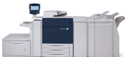
Barevná produkční tiskárna Xerox® 770