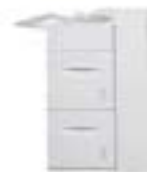
Velkokapacitní podavač se 2 zásobníky Kapacita každého 2 000 listů (celkem 4 000 listů): formát Letter