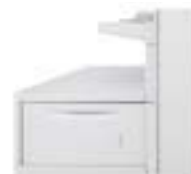
Velkokapacitní podavač pro velké formáty 2 000 listů: až 330 x 488 mm