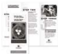
Dvojitý sklad, sklad ve tvaru C, sklad do tvaru Z