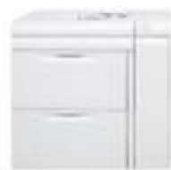
Velkokapacitní podavač pro velké formáty se 2 zásobníky Každý zásobník po 2 000 listech (celkem 4 000 listů): až 330 x 488 mm